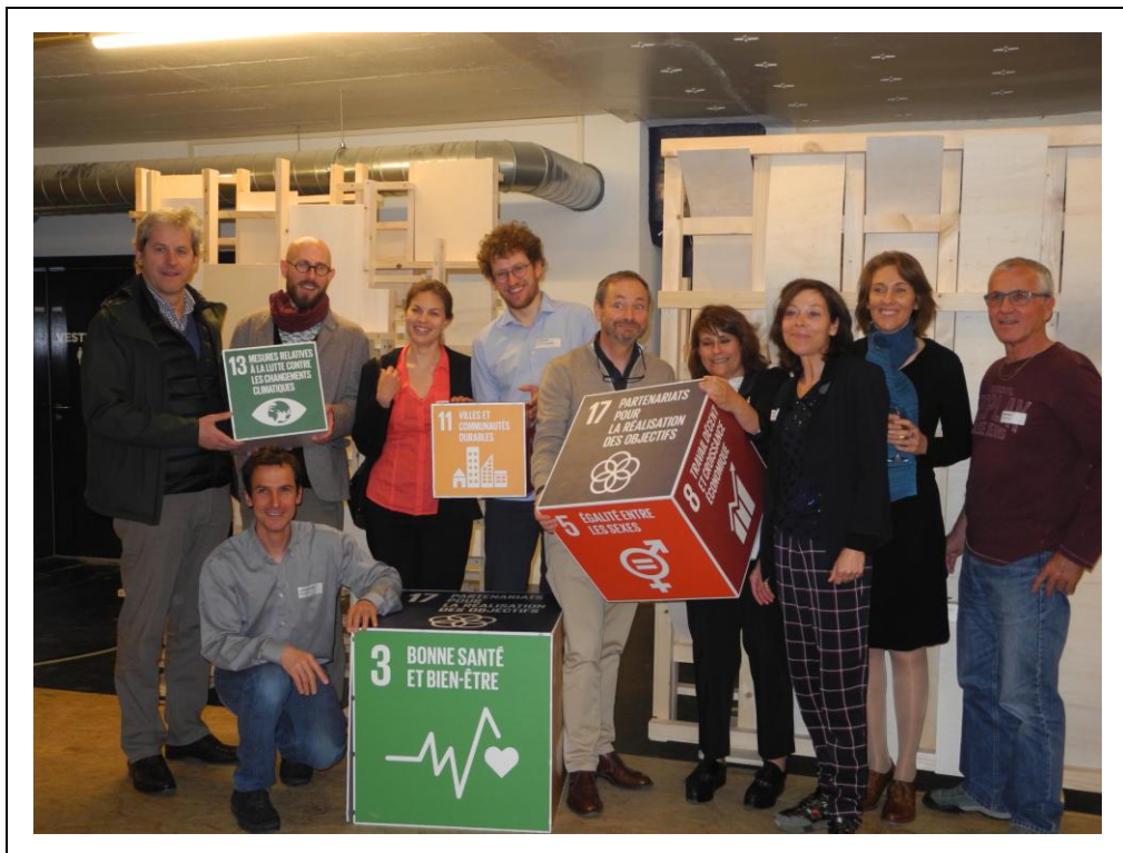
Photographie: Assemblée générale de Coord21, 21 mai 2019, BlueFACTORY de Fribourg